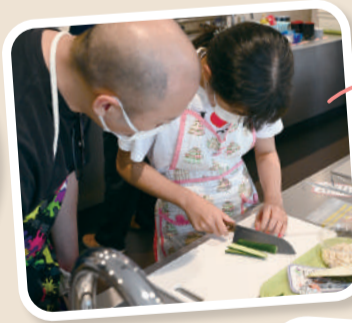
きゅうりのさいの目切りに挑戦！お父さんの見守る中、慎重に切り進めます