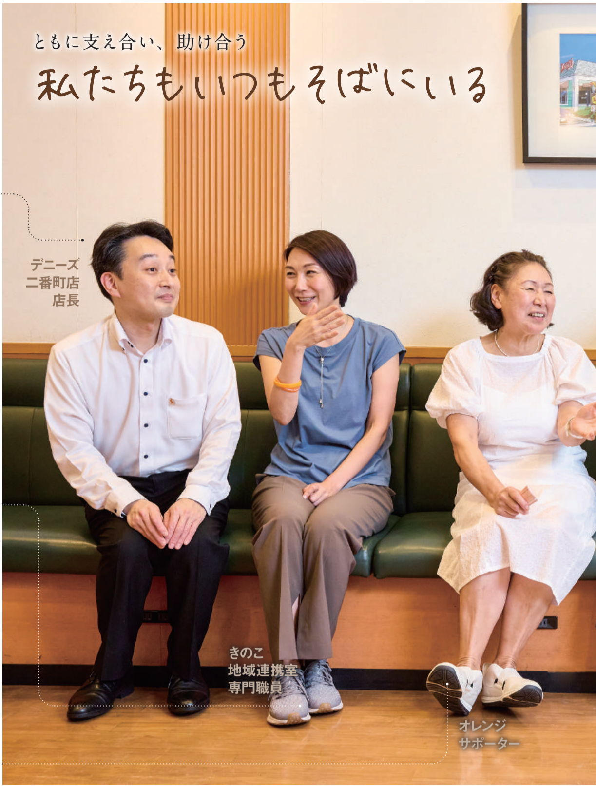
デニーズ 二番町店 店長