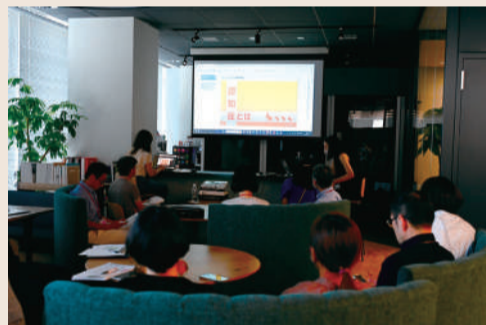
(株)真和での開催の様子。80名規模の会社で30名ほどが対面やオンラインで受講しました

大切なのは気づくこと 早くから現れる症状は2つ。目の前にいる人が誰なのか、約束したこと自体を忘れてしまう「記憶障害」と、夏にセーターを着たり、予定の時間に合わせて準備するのが難しくなったりする「見当識障害」です。 具体的な症状を知るのは、認知症の方が暮らしやすい環境を調えるための第一歩だと感じました。また、周囲が「あれ、おかしいな」とちょっとした違和感に気づけることが早期発見につながるのだと実感しました。 5つの「ない」 認知症の方への対応は、「驚かせない、急がせない、自尊心を傷つけない、否定しない、怒らない」の5つの「ない」が大きなポイント。後ろから声をかけると驚かせてしまうので、一定の距離で相手の視野に入ってから声をかけること、優しい口調で穏やかに話しかけること、話し方を心がけることなど、接し方のアドバイスは誰でも簡単に行えるものでした。