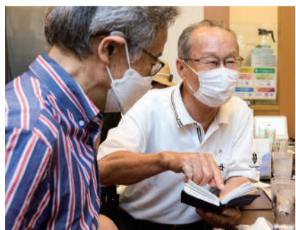
「歩いた歩数をメモしているんですよ。1万歩はなかなか難しいね」と健康づくりの話もはずむ。

そうした皆さんへの“機会”のひとつに、ありのままの自分でいられる“ある集まり”があります。気軽に外出し、楽しい時間を過ごす場所。いま、そんな機会づくりの輪が広がっています。