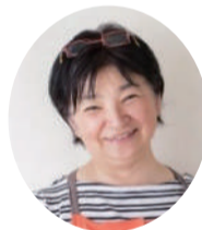
林幸子氏 (料理研究家)