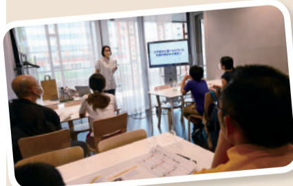
食事の後は、使用した食材のことを深掘り。中には家康の愛した食材も