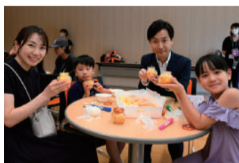
認知症のイメージカラー「オレンジ色」のアロマキャンドルを装飾しました