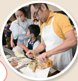
親子で分担して 手際よく調理