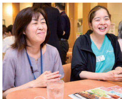
「あの時は、びっくりしたよね」と24時間対応の相談センター職員。訪問看護師と談笑。

千代田区で行われている実例の会は、認知症の本人やご家族が互いの近況を語りながら、楽しい時間を過ごす場として、毎月開催されています。3会場の内、2つはまちの飲食店。「他の方と同じように気軽に外出し、過ごしていただく機会を作りたかったから」と区の担当者。この会を機会に、新たな交流も生まれているのだそうです。