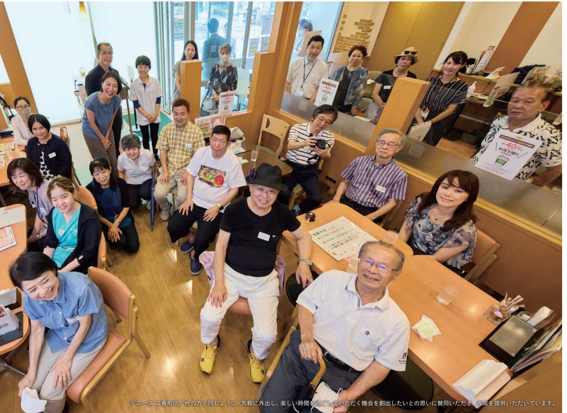
デニーズ 二番町店/他の方と同じように、気軽に外出し、楽しい時間を過ごしていただく機会を創出したいとの思いに賛同いただき、客席を提供いただいています。