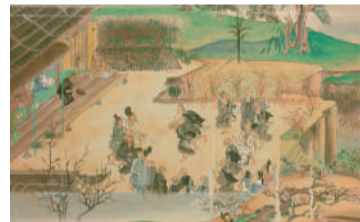
盆踊り祖先、踊り念仏の誕生(といわれている)シーン 一遍聖絵第4巻

盆踊りの起源のひとつは、「踊り念仏」といわれています。鎌倉時代の僧、一遍が始め、やがて先祖供養の意味で盆に踊られるようになりました。