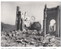
長崎原爆資料館所蔵 撮影：米軍