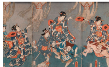
江戸時代の盆踊りの風景を描いた錦絵 源氏十二月之内 孟秋 (東京都立図書館所蔵)

江戸時代には各地に根付き、華やかで熱狂的なものとなって、庶民の非日常として楽しまれました。あまりの盛況ぶりに一揆につながることを恐れた幕府が、踊る時期や場所を制限することも。明治時代には、盆踊りは風紀を乱し「近代国家にはふさわしくない」と各地で禁止令が出され、一時は消滅の危機に瀕しました。